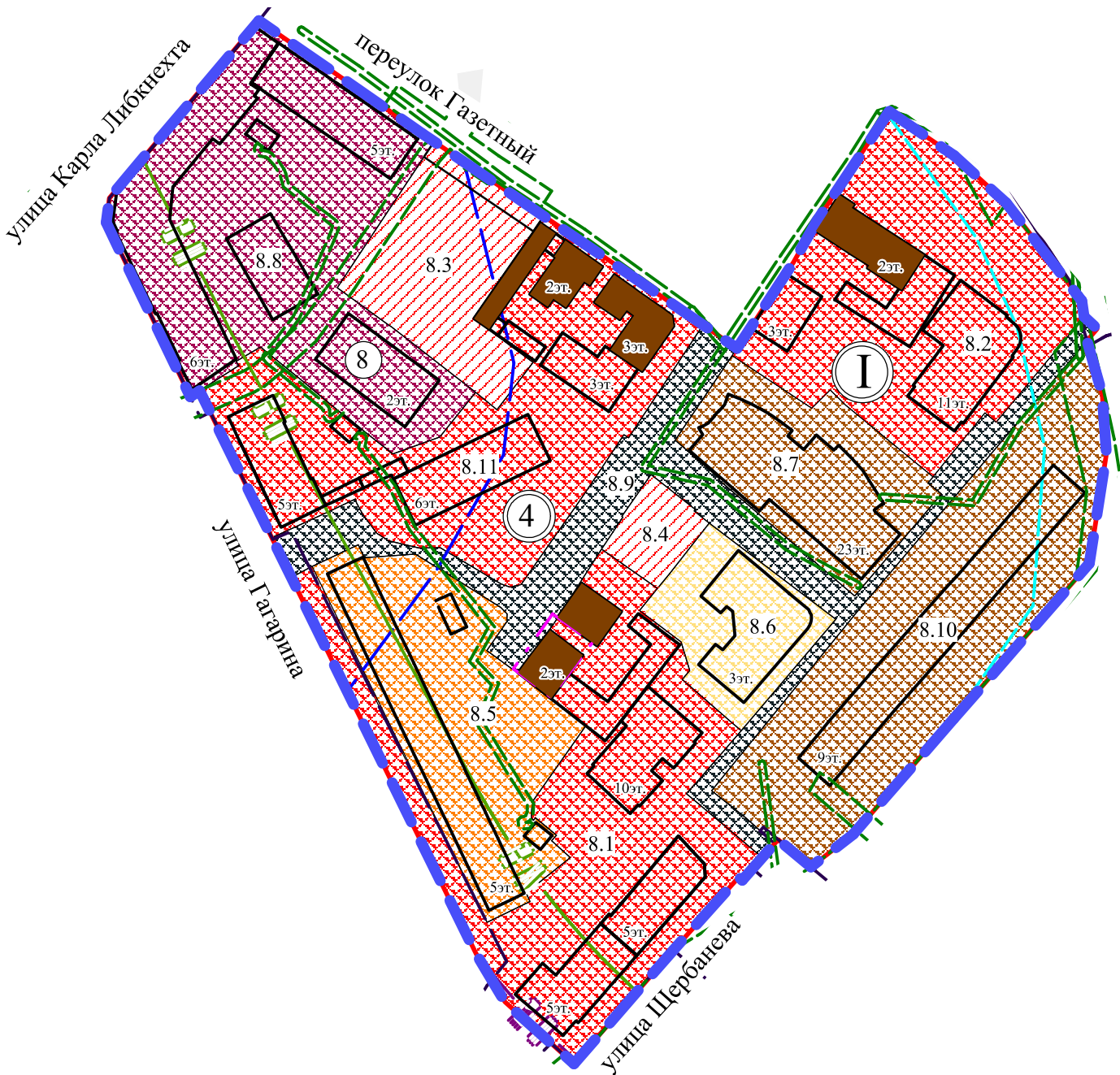
Экспликация зон элемента планировочной структуры № 8 микрорайона № 4 планировочного района I